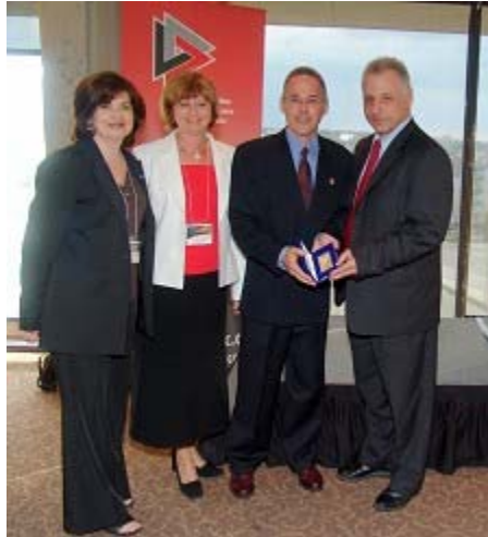
Plume d'Or : Promotion/marketing Ville de Gatineau avec sa campagne sur les nids-de-poule