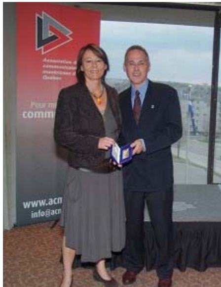
Plume d'Or : Événements spéciaux Ville de Québec, Institut Canadien du Québec pour sa Méga Bibliovente